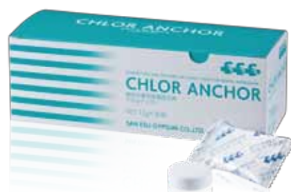
クロルアンカー 歯科印象用除菌固定剤 錠剤 12g×30包/箱